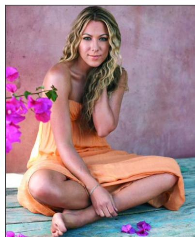
Mit Fallin' For You vom neuen Album Breakthrough schickt Colbie Caillat ihren nächsten Ohrwurm ins Rennen.